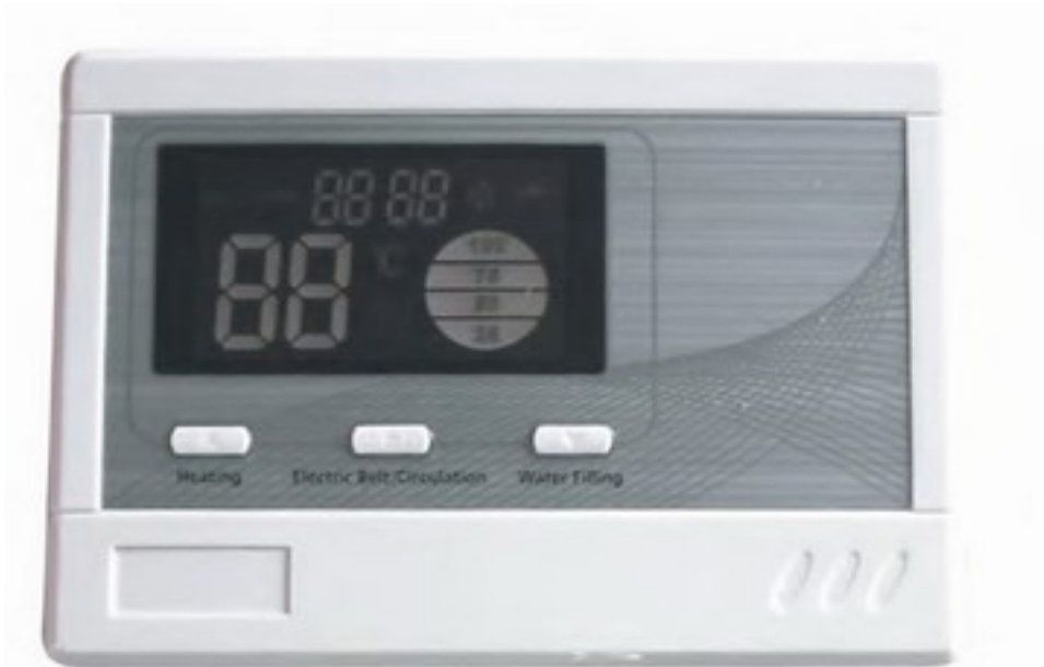
56 Controller P: Sistem solar Confort Plus. Hidrola temperatura interapele de boiler. Sistemul