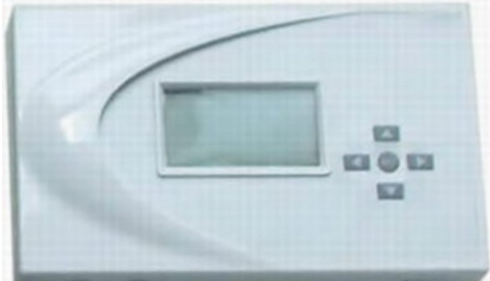
56 Controller G: Sistem solar Premium Premium Plus. Hidrola temperatura interapele de boiler. Sistemul