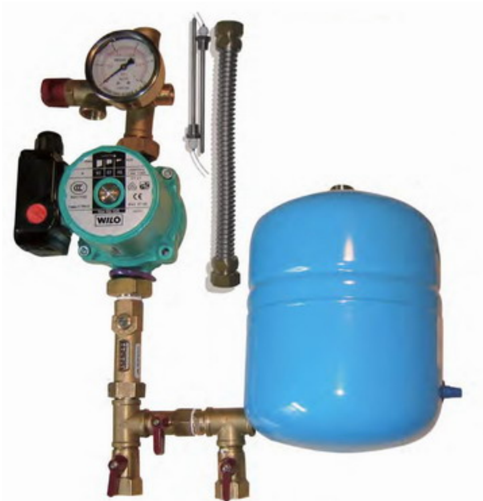
Sistemul de pompa Sistem Solar Premium Blue este un produs de calitate care este recomandat pentru toate sistemele de încălzire solară. Este un produs de calitate care este recomandat pentru toate sistemele de încălzire solară. Este un produs de calitate care este recomandat pentru toate sistemele de încălzire solară.