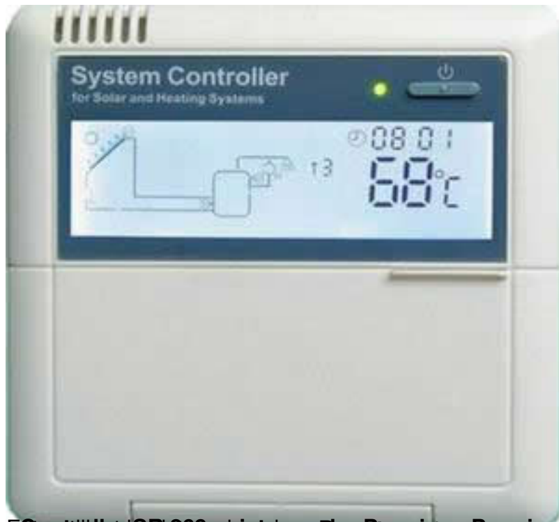
Controler SR-668 pentru sisteme solar Premium, Premium Plus (cu funcție de programare și de